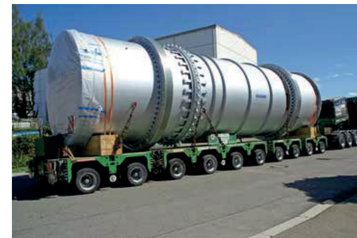
Trocken-Kühltrommel MOZER TK+ für 100 t/h Sand

Zweizugtrommeltrockner Typ MOZER ab Baujahr 1985 unter Berücksichtigung der bestehenden Einbauverhältnisse und Verwendung der vorhandenen Abluftreinigungsanlage auf das System TK+ umzurüsten.