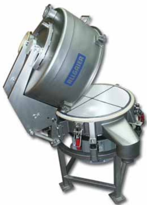
転倒式蓋付きの振動篩機VTS600