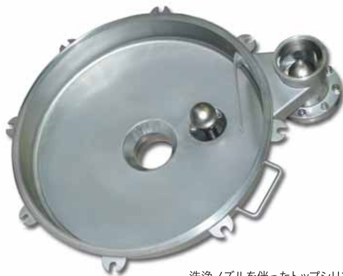
洗浄ノズルを伴ったトップシリンダーの蓋