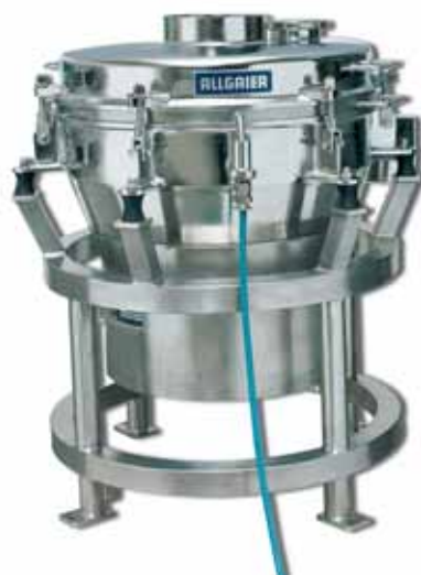
超音波洗浄を伴った振動篩機 VTS 800