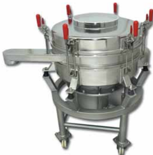
キャスター移動可能仕様のVTS600