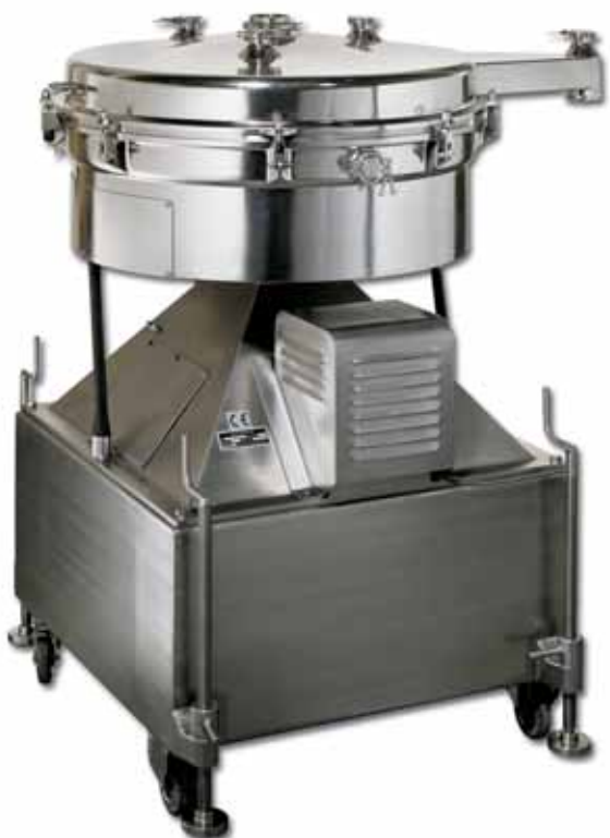
キャスターで移動可能な揺動式篩機 TSM1200